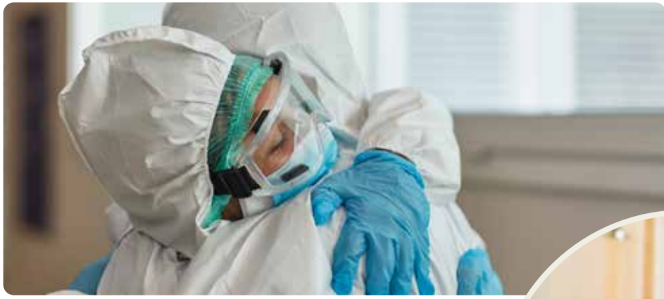
Pandemin visade på bristerna i välfärden. Vänsterpartiet vill bygga samhället starkt igen.

att välfärden ska bli sämre hela tiden, det beror helt på politiska beslut. Vi måste ta tillbaka kontrollen över skola, vård, omsorg och infrastruktur. Det fungerar inte att ge mindre och mindre pengar till verksamheter som dessutom ska ge en allt större andel av de pengarna till privata bolagsvinster. Det har slagit sönder välfärden och skapat otrygghet.